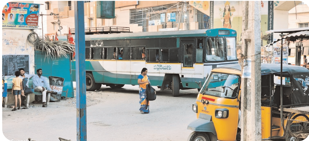
సౌకర్యవంతమైన రవాణా అందించడమే మా లక్ష్యం. మొత్తంగా, గ్రామపంచాయతీ తీసుకున్న ఈ చర్య బోనకల్లో అందుకోసం అందుబాటులో ఉన్న ప్రతి వనరును ఉపయోగించుకుంటూ సమస్యలకు పరిష్కారం చూపుతాం” అని తెలిపారు.

మరియు బ్రిడ్జి చివరగా ఉన్న మరొక కానాను వాహనాలు నిలిపేందుకు ఈ ప్రాంతాలను వాహనాల రాకపోకలకు అనుకూలంగా మార్చి, ప్రత్యామ్నాయ మార్గాలుగా అభివృద్ధి చేయాలని పంచాయతీ యోచిస్తోంది. ఇప్పటికే కొన్ని కాణాల కింద కొంతమంది స్థానికులు సొంత ప్రయోజనాల కోసం అక్కడ ఉన్న చెట్లను క్రమక్రమంగా తొలగించి గేదెలను కట్టివేయడం మరియు వ్యాపారాలు చేసుకోవడం కోసం ఉపయోగించుకుంటున్నారు. అందరికీ ఉపయోగపడే స్థానిక ప్రాంతాలు కొంతమంది మాత్రమే అనుభవిస్తుండడంతో స్థానికులకు తీవ్ర ఇబ్బందులు పడుతున్న విషయాన్ని స్థానిక పంచాయతీ పాలకవర్గం గమనించింది. ఈ చర్యతో ప్రధాన రహదారిపై ఉండే ఒత్తిడి తగ్గి, వాహనదారులకు సులభంగా ప్రయాణం చేసే వీలుంటుందని అధికారులు భావిస్తున్నారు. స్థానిక వ్యాపారులు, ప్రజలు ఈ నిర్ణయాన్ని స్వాగతిస్తూ, ట్రాఫిక్ సమస్యకు దీర్ఘకాలిక పరిష్కారం లభిస్తుందని ఆశాభావం వ్యక్తం చేస్తున్నారు. గ్రామ పంచాయతీ పాలకవర్గం మాట్లాడుతూ, “ప్రజలకు